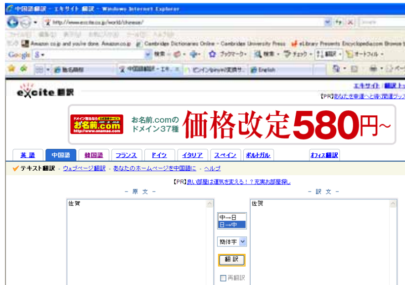
エキサイト中国語翻訳