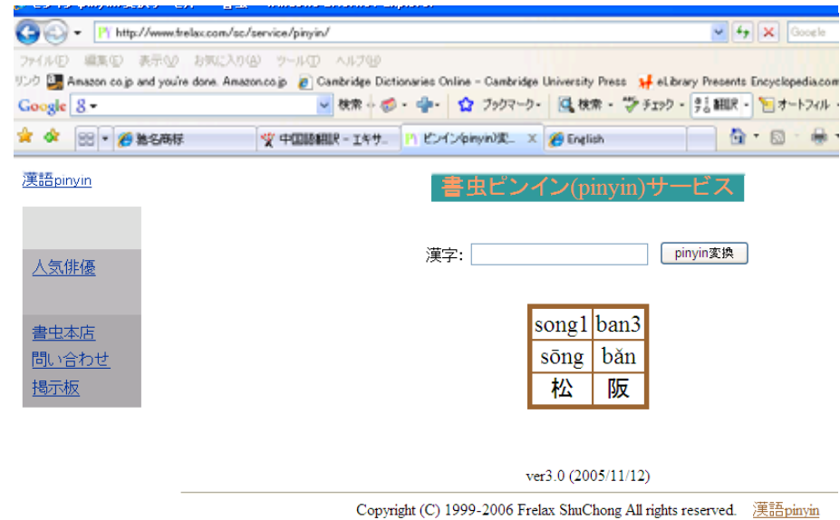
書虫ピンイン(pinyin)変換サービス

http://www.frelax.com/sc/service/pinyin/